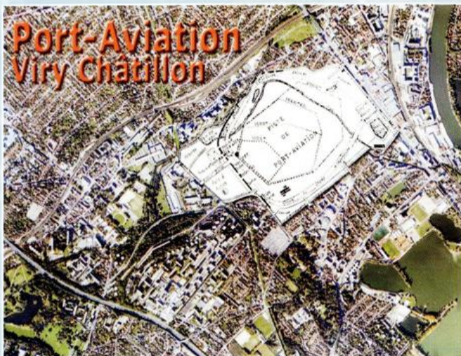
Port-Aviation Viry Châtillon